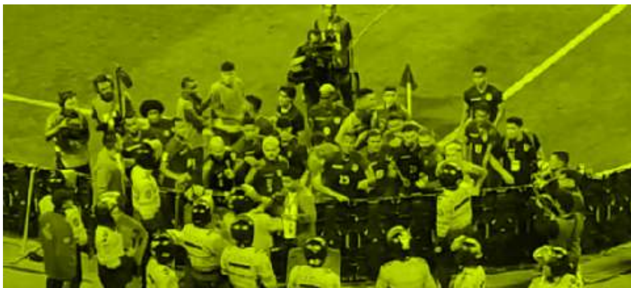
Foto: Policía de Perú impidió que la Vinotinto saludara a venezolanos

Las eliminatorias sudamericanas siempre han sido un escenario de gran pasión y rivalidad entre las selecciones de fútbol de la región. Sin embargo, lo que presenciamos antes, durante y después del partido entre las selecciones de Perú y Venezuela, fue algo inédito. En esta ocasión, examinaremos los hechos xenofobos y discriminatorios que ocurrieron en el marco del juego de ida de la Vinotinto.