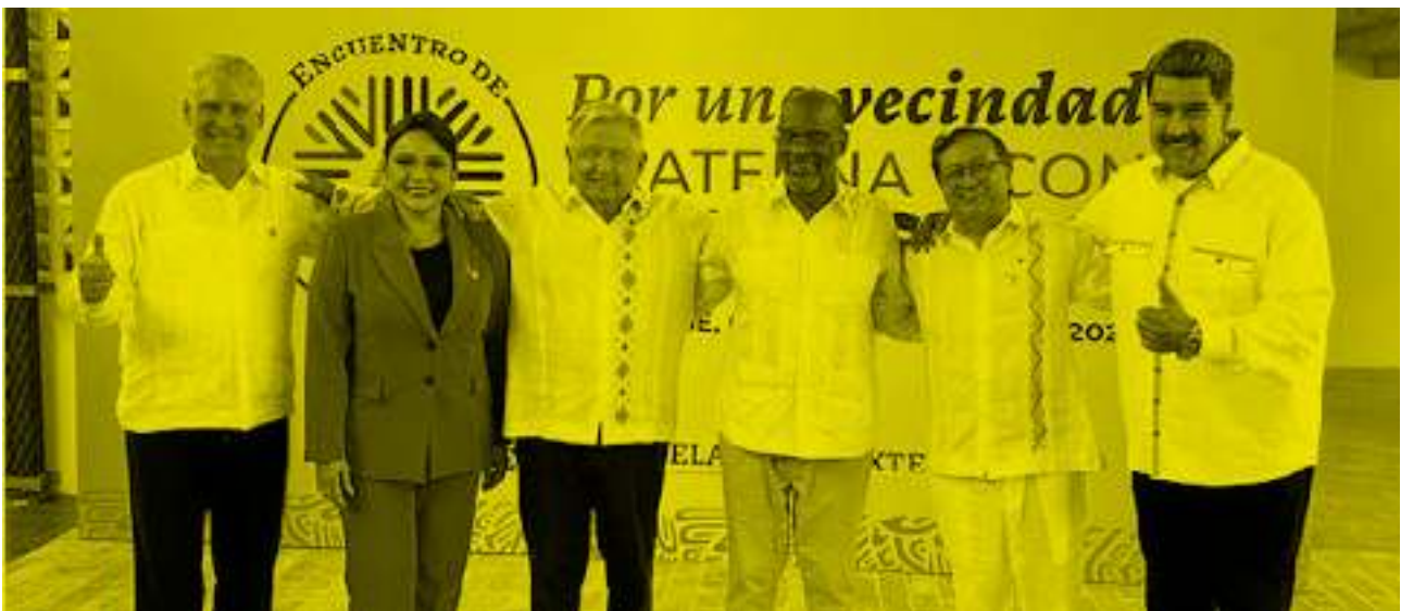
Foto: Jefes y Jefa de Estado de Cuba, Honduras, México, Haití, Colombia y Venezuela

Resulta crucial señalar que el Encuentro de Palenque marcó un hito en la búsqueda de soluciones a la migración en el continente. Desde SURES consideramos que este tipo de eventos de Alto Nivel en materia migratoria son fundamentales para garantizar los derechos de millones de migrantes. La cooperación y el diálogo entre los Estados y los líderes de la región, con apoyo de las organizaciones y movimientos sociales, son necesarios para trabajar juntos en aras de abordar las causas estructurales y coyunturales de la migración y sentar las bases para construir un futuro más seguro y próspero para todos los habitantes de la región.